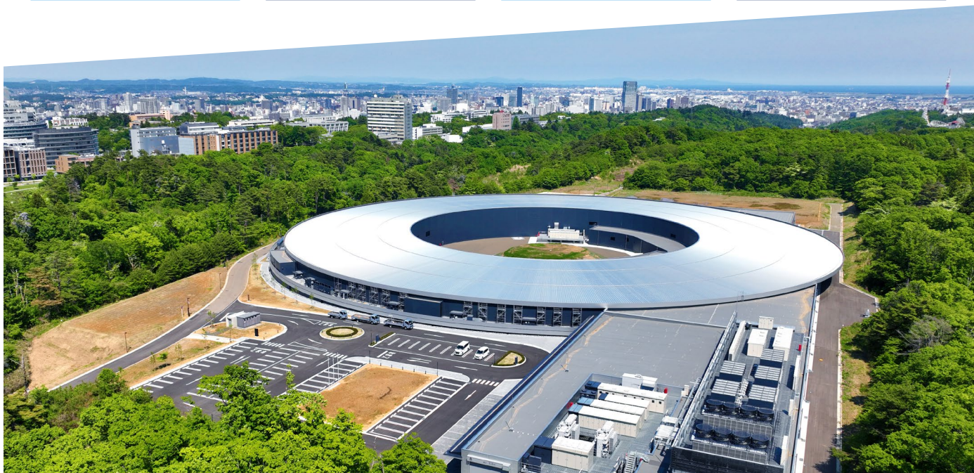
ナノテラス全景(2024年4月運用開始予定・仙台駅から地下鉄で9分)